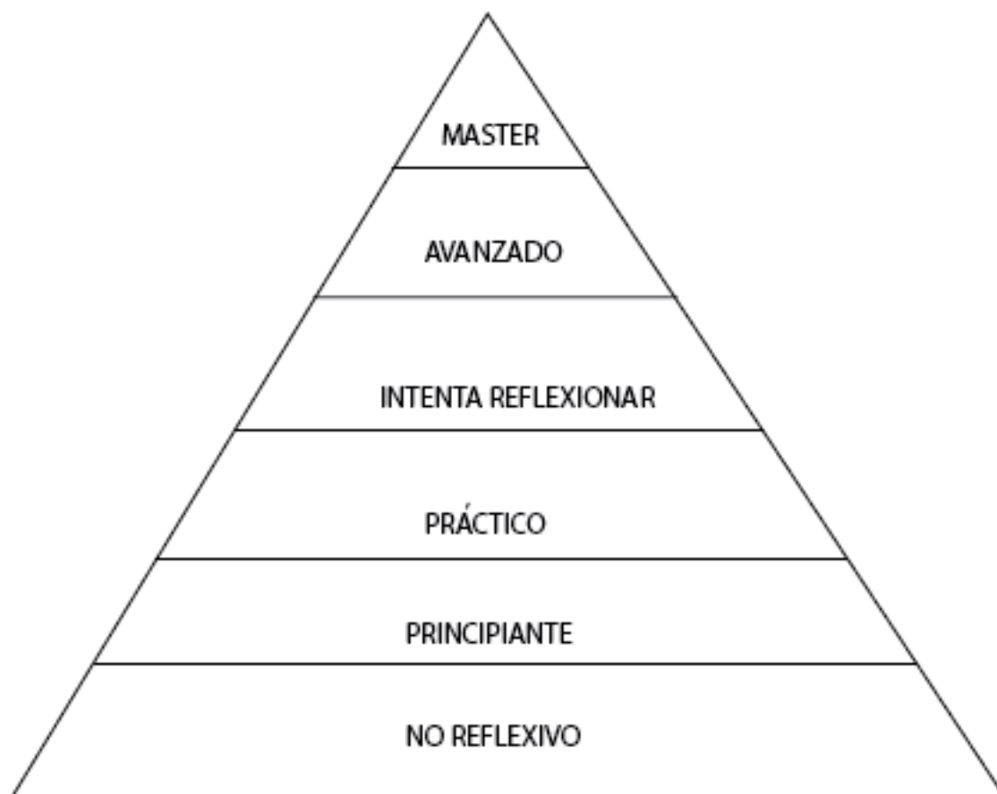
Figura 2, Fuente: Paul, Richard y Elder, Linda, 2006.

García Mantilla 25 hace referencia al desarrollo del pensamiento crítico, haciendo énfasis en cómo cada aprendizaje que se obtiene es el resultado de un proceso de pensamiento crítico aunque muchas veces no se pueda ser consciente de tal hecho. López Aymes 26 plantea cómo la escuela no se debe enfocar tanto a saberes específicos en ciertas disciplinas; sino, en enseñar métodos de aprendizaje para que el estudiante continúe de manera consciente su proceso formativo fuera de la institución; en otras palabras, el estudiante necesita “aprender a aprender”; al respecto Paul y Elder 27 hacen mención frente a que “la única capacidad que podemos usar para aprender, es el pensamiento humano. Si pensamos bien mientras aprendemos, aprendemos bien. Si pensamos mal mientras aprendemos, aprendemos mal” por lo cual, el “pensar bien” que plantea Lipman 28 el inicio para desarrollo crítico influye de manera relevante en el proceso de enseñanza aprendizaje ya que es la condición primordial para que dicho proceso se dé a cabalidad.