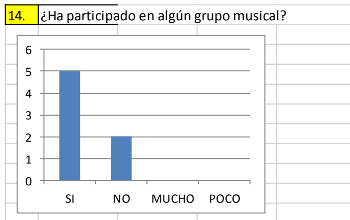
Gráfico 2 – Participación en grupos musicales

La anterior pregunta pertenece a la categoría denominada Motivación, según la tabla, 6 de los 7 jóvenes encuestados respondieron de manera negativa a la pregunta, lo que manifiesta que desde el principio hubo una gran motivación por parte de los participantes.