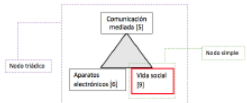
Esquema 5. Nodos triádicos. Resultado de la segunda agrupación

Posteriormente al tomarse las dos triadas simples para unir aquellas agrupaciones simples pero con aspectos comunes, se obtiene un nodo triádico como el que se puede apreciar en el esquema 5.